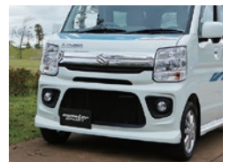
スポーツフロントバンパー