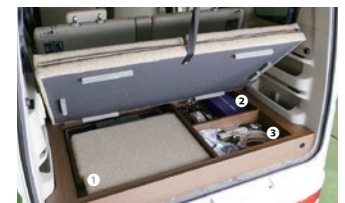
① ベッドボード一部 ② 電源システム ③ 車載工具