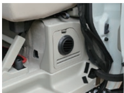
吸排気分離式FFヒーター